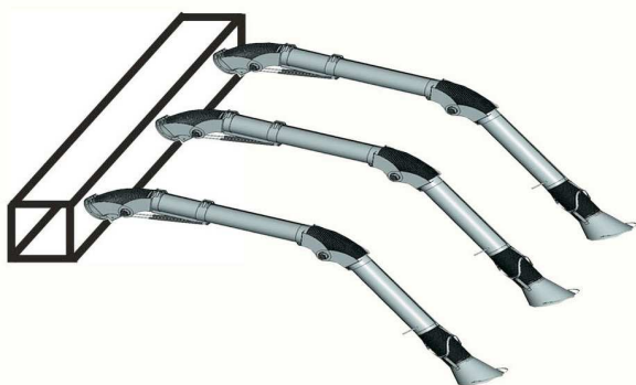
Рис. 1 Радиально-вытяжное устройство РВУ для центральной аспирационной системы.

РВУ также могут быть использованы для оснащения участков (столов) пайки.