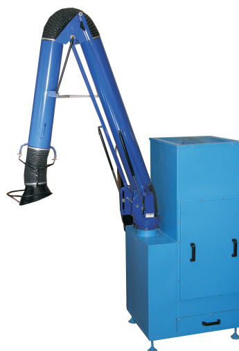
Рис. 2 Радиально-вытяжное устройство РВУ в составе агрегата ПАР.