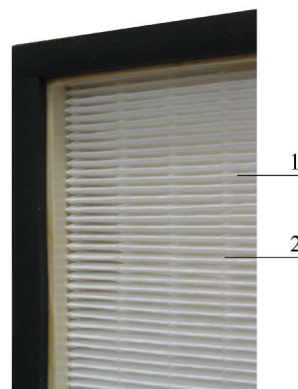
Рис.2 Фрагмент фильтра с нитевыми сепараторами; 1 – фильтрующий материал; 2– пластиковая нить.

Корпус фильтра может быть изготовлен из специального алюминиевого профиля, нержавеющей стали или МДФ. Фильтры из алюминиевого профиля могут изготавливаться глубиной 78; 150 и 300 мм. В тех случаях, когда корпус фильтра изготавливается из МДФ или нержавеющей стали, глубина фильтров может отличаться от указанной выше. Фильтрующий материал, включающий алюминиевые или нитевые сепараторы, герметизируется в корпусе путем заливки по всему периметру специальным герметиком 4 (рис.1). Корпус фильтра по всему периметру образует фланец (прижимную поверхность), размер которого для алюминиевого профиля составляет 15мм, для МДФ 12мм, а для корпуса из нержавеющей стали 18мм. На этот фланец наносится резиновое уплотнение (с одной или двух сторон). На входе и выходе (или с обеих сторон) фильтра может устанавливаться специальная решетка, обеспечивающая защитную, декоративную и воздухораспределительную функцию.